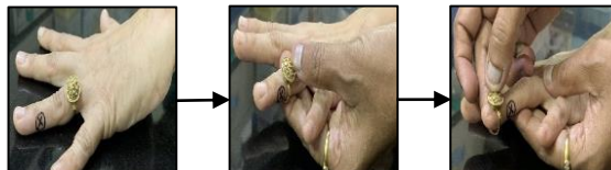
ସାପ କାମୁଡ଼ିବା ସ୍ଥାନରେ ଫୁଲା ଦେଖାଯାଇପାରେ। ତେଣୁ ଜୋଡ଼ା, ମୁଦି, ହାତଘଡ଼ି, ବ୍ରେସ୍ଲେଟ୍ କିମ୍ବା ଟାଇଟ୍ ପୋଷାକ ଯଥାଶୀଘ୍ର ବାହାର କରିବା ଆବଶ୍ୟକ