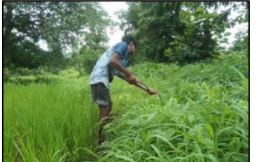
ଘାସ କାଟିବା ପୂର୍ବରୁ ଏକ କାଠ କାଠିକୁ ହଲେଇ ଦିଅନ୍ତୁ