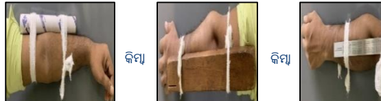
ଖବରକାଗଜ ରୋଲ୍ କିମ୍ବା କାଠ କାଠି କିମ୍ବା ଇସ୍ପାତ ସ୍ୱେଲର ବ୍ୟବହାର କରନ୍ତୁ ଦଂଶନ କରିଥିବା ଅଙ୍ଗକୁ ଅଳ୍ପ ରଖିବାପାଇଁ