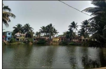
ପହଁରିବା ବେଳେ ସତର୍କ ରୁହନ୍ତୁ