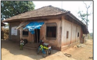
ଘର ଓ ପରିସରକୁ ସଫାସୁତୁରା ରଖନ୍ତୁ