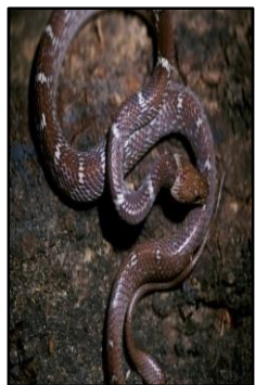
କଉଡ଼ିଆ ଚିତି ସାପ