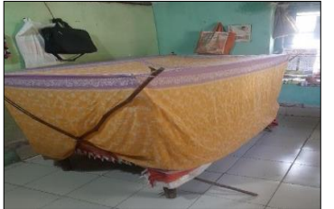
ଶୋଇବା ସମୟରେ ମଗାରି ବ୍ୟବହାର କରନ୍ତୁ