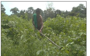
ଘାସ/ଜଙ୍ଗଲ ଦେଇ ଚାଲିବା ସମୟରେ ବାଡ଼ି ବ୍ୟବହାର କରନ୍ତୁ