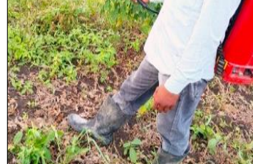
କାମ କୁରିବା ସମୟରେ ଆଣ୍ଡୁ ଯାଏଁ ବୁଟ ବ୍ୟବହାର କରନ୍ତୁ

ସାପ କାମୁଡ଼ିଲେ ଧୀରେ ଧୀରେ ସାପଠାରୁ ଦୂରରେ ଯାଆନ୍ତୁ ଏବଂ ତୁରନ୍ତ ସାହାଯ୍ୟ ପାଇଁ ଫୋନ୍ କରନ୍ତୁ । ବୌଦ୍ଧିକ ନାହିଁ କି ବ୍ରତ ଗତିରେ ଚାଲନ୍ତୁ ନାହିଁ